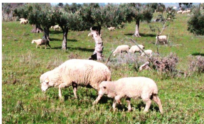
Figura 5. Ovelha parida