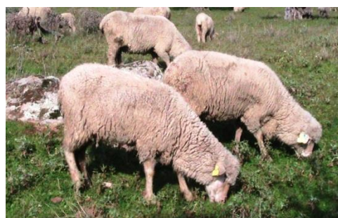
Figura 2. Fêmeas