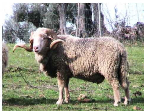
Figura 1. Macho