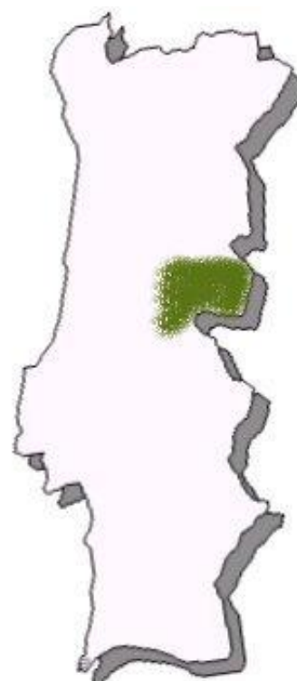
Figura 3. Distribuição geográfica

A sua tripla função, embora não especializado em cada uma delas, permite ao criador um rendimento que qualquer outro animal não lhe proporcionaria. Por outro lado, os Merinos da Beira Baixa contribuem numa forma muito evidente para a fertilização das terras pobres onde pastam (17).