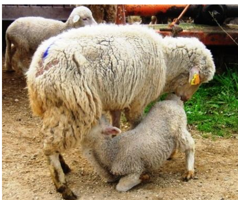
Figura 7. Borrego a mamar

A ordenha inicia-se em fins de Outubro/Novembro e vai até ao S. João (cerca de 8 a 9 meses).