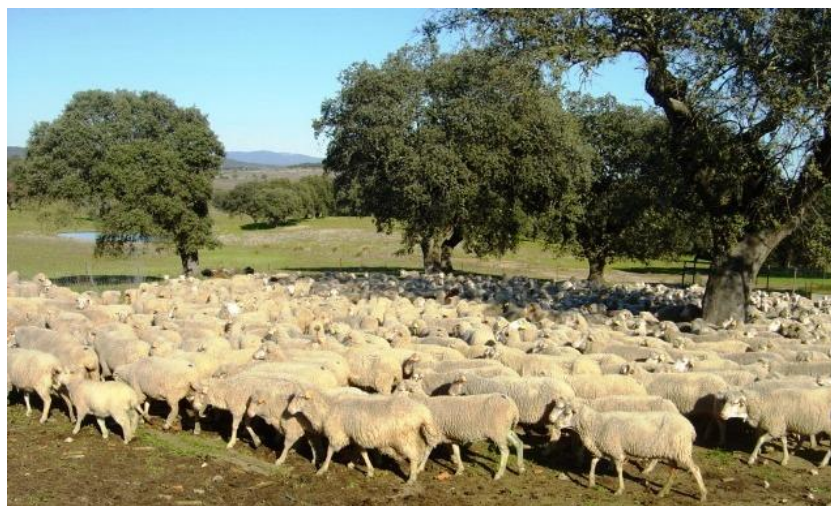
Figura 4. Rebanho

É do conhecimento geral que, o Merino da Beira Baixa pelas suas características produtivas, não é um animal especializado em qualquer das produções, leite, carne e lã, mas pela tradição da exploração ovina no Distrito de Castelo Branco tem como principal fonte de receita o leite e produtos derivados (3).