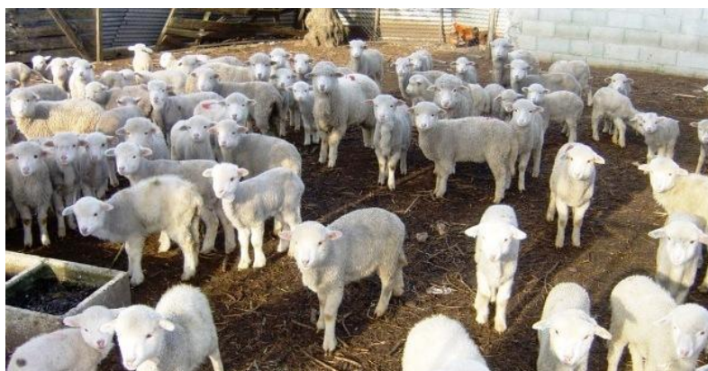
Figura 6. Borregos

De qualquer modo, seria impensável canalizar a produção para a engorda intensiva pela falta de potencialidade dos borregos em linha pura, e pouco melhor de cruzados com raças exóticas de carne através dos cruzamentos industriais. A par dos custos de alimentação e da diferença de preços enquanto borrego de "canastra" e a quebra que se verifica no final da engorda, quando têm 25 Kg ou mais, há a considerar a forte concorrência do mercado internacional para o borrego pesado que hoje em dia já é comercializado às peças e refrigerado e embalado a vácuo.